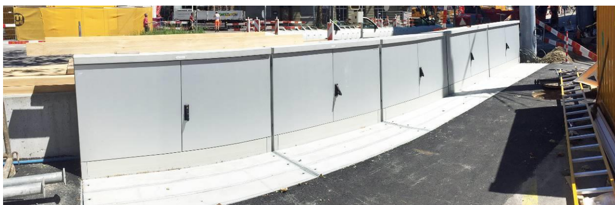
Deposito dei tram, Eigerplatz, Berna

Spesso, i nostri clienti ordinano armadi di distribuzione per adeguare uno esistente. Di tanto in tanto, però, può capitare che in caso di grandi progetti venga allineato più di un armadio. In questi casi, fino alla fine dell'anno scorso era impossibile mettere in fila gli armadi di distribuzione senza lasciare, tra l'uno e l'altro, un'intercapedine di circa 3 cm. Questo piccolo difetto (vedi esempio sottostante) ogni tanto veniva considerato come importuno.