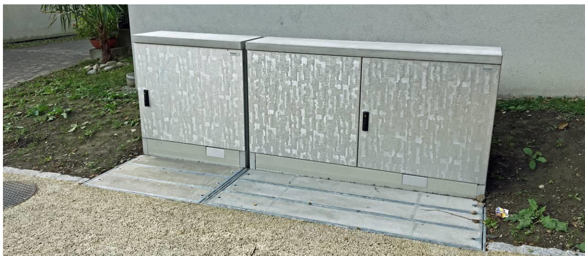
Illustration Schützenmatte, Altdorf

Le lancement de la nouvelle cave à câbles nous permet de remédier à ce défaut esthétique, car nous pouvons désormais juxtaposer les cabines de distribution, sans aucun espace entre elles. Les produits Borner ne se limitent pas à remplir les directives techniques, à les respecter et les conditionner en innovations, mais ils s'acquittent également de toutes les exigences en matière d'esthétique et de design.