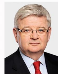
Joschka Fischer Ancien vice-chancelier et ministre des affaires étrangères de la République fédérale d'Allemagne

„Énergie stratégie, physique on ne peut pas faire de beaux discours!“